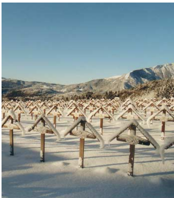
Lavarone, Slaghenaufi, cimitero militare