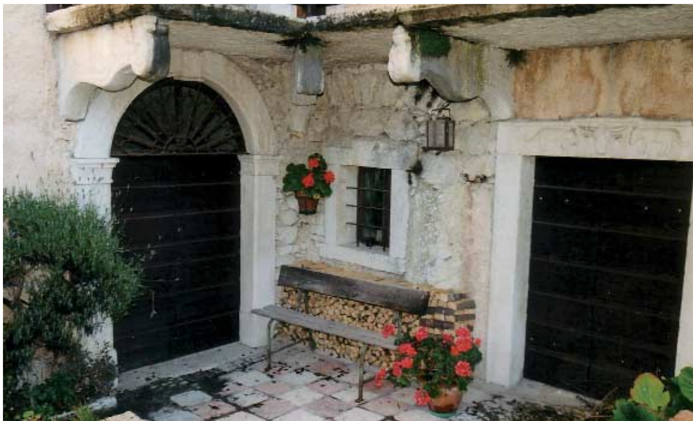
Lavarone, Oselli, particolare di un'antica casa

Legno, di uno studio finalizzato alla valorizzazione della produzione legnosa, volto ad individuare le caratteristiche tecnologiche del legname degli Altipiani ed una nuova metodologia per la mappatura del territorio;