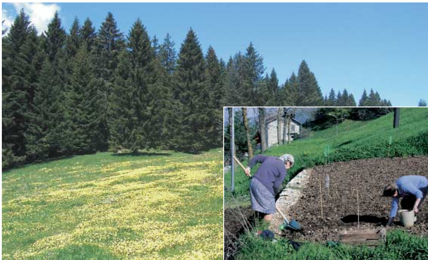
Luserna - Lusérn, pascoli in fiore e foresta di conifere