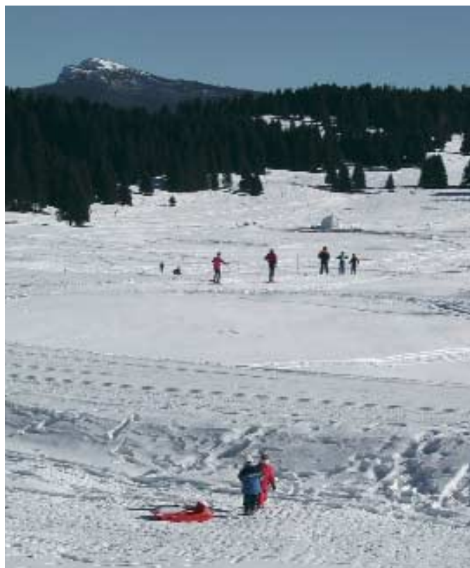
Luserna - Lusérn, bambini sulla neve a Millegrobbe