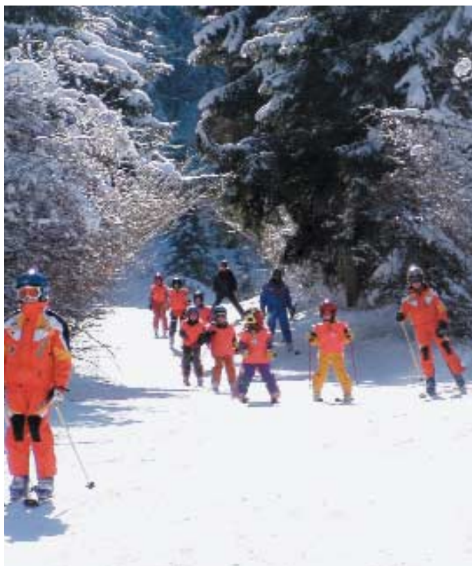
Folgaria, scuola di sci

La crisi del potere di acquisto di ampie fasce della popolazione apre dall'altra, se non veri e propri vuoti, una riduzione dei periodi di vacanza, spesso trasformati in brevi mordi e fuggi, e/o un contenimento della spesa