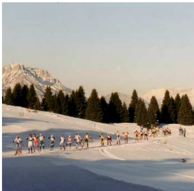
Lavarone, Millegrobbe

Uno dei settori in cui le trasformazioni in corso sono infatti particolarmente rapide e profonde è il turismo. La