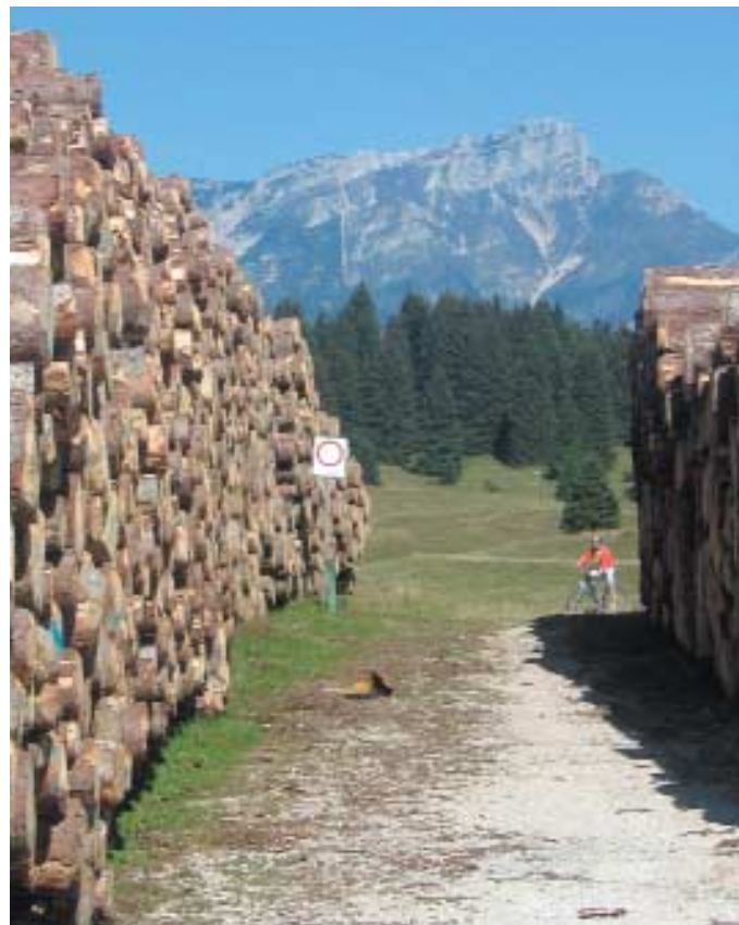
Numerose le iniziative già intraprese dai tre Comuni per la valorizzazione della risorsa legno

Altipiani nell'ambito del mercato turistico" e che entro il mese di giugno debbano essere concluse le analisi di settore, fornendo così gli strumenti fondamentali per il nuovo piano di sviluppo della Comunità.