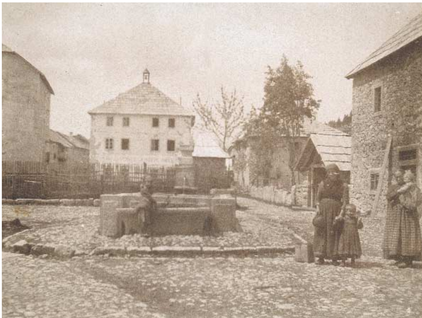
Luserna nel 1905