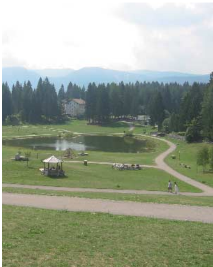
Lavarone, Palù, frazione Cappella

A) Sul piano demografico, si percepiscono i primi segnali di una possibile inversione di tendenza. Gli indici di natalità non sono più, sempre e solo, orientati alla diminuzione, i flussi di immigrazione tendono più che a compensare quelli di emigrazione, qualcuno ritorna, qualche turista decide di risiedere da noi ed è ragionevole pensare, per ragioni che non è qui possibile approfondire, che tali dinamiche siano destinate a migliorare nel tempo. Il nodo irrisolto è quello dell'occupazione dei giovani, principalmente di quelli con la formazione più elevata. Qualche cosa certamente si può fare in diversi settori della nostra economia, in primo luogo nel settore privato, ma anche nello sviluppo di servizi collegati al turismo; ciò che non dobbiamo fare, per quanto possibile, è smobilitare ulteriori servizi pubblici di interesse economico e non, affidandoli a scatola chiusa ad imprese esterne; dobbiamo sapere che ogni