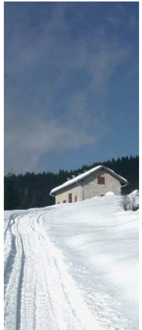
Luserna - Lusérn, malga Campo