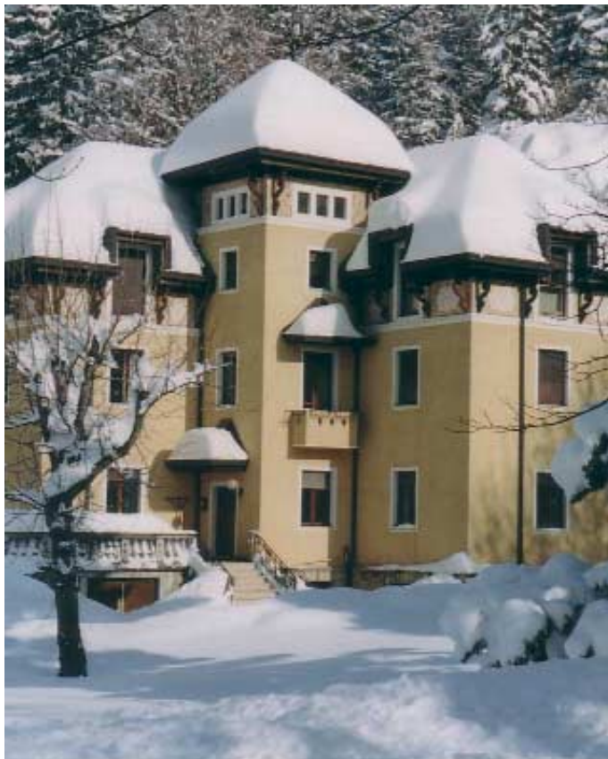
Lavarone, Gionghi, Villa Lancerotto

verranno messe in campo soluzioni via via meno efficaci ed efficienti. Ma vi è di più, la soffocante pressione della quotidianità e dell'emergenza continua assorbe ormai gran parte delle energie e degli sforzi di pur impegnati amministratori, con un prezzo sempre più elevato in ordine alle capacità di previsione a medio e lungo termine, di programmazione, ovvero di Governo con la "g" maiuscola.