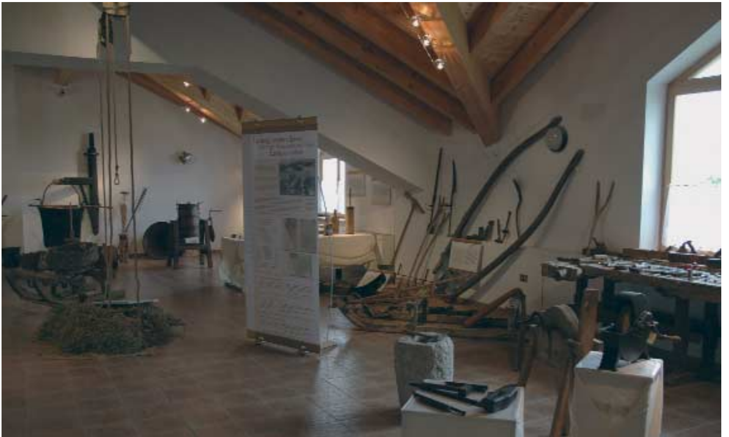
Luserna - Lusérn, sottotetto della sede del Centro Documentazione Luserna