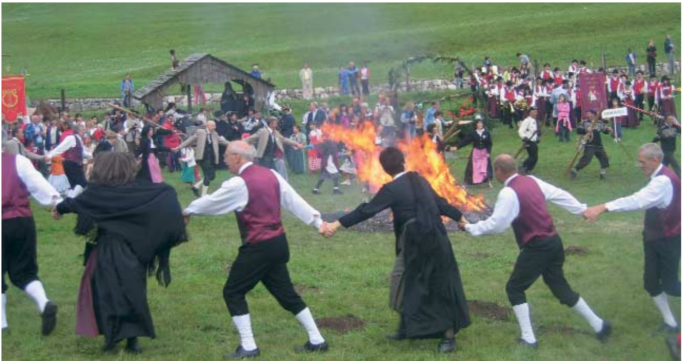
Folgaria, la Brava Part