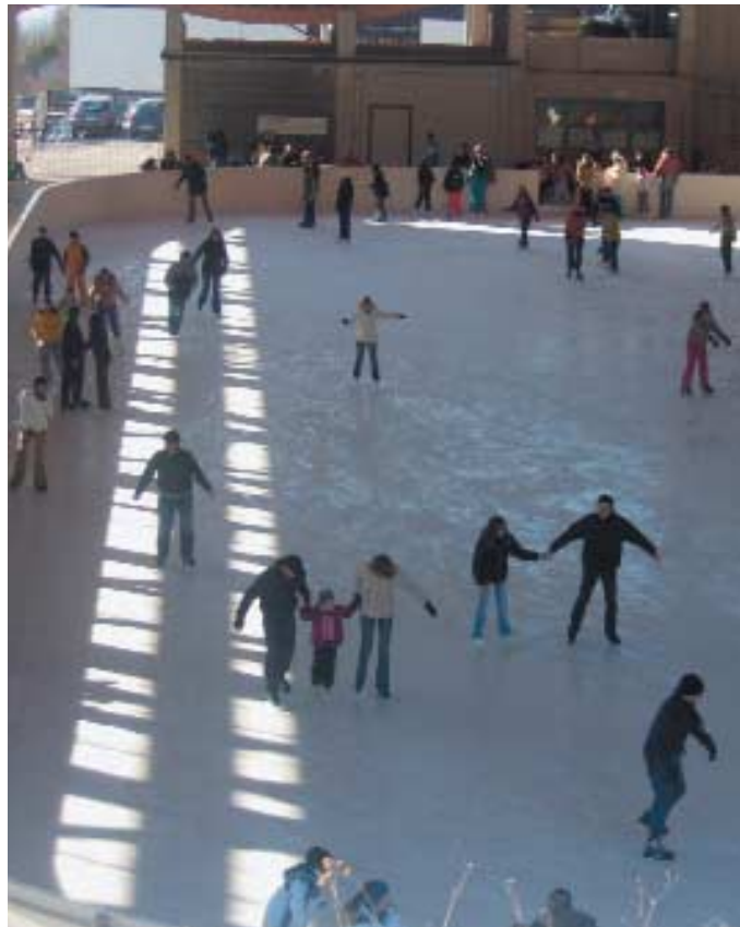
Folgaria, pattinatori al Palaghiaccio

In sostanza pensiamo che sbaglia chi pensa di rispondere a tutto ciò mettendo in atto un attivismo generalizzato fine a se stesso, sbaglia chi crede di trovare la risposta in singoli progetti, anche se di grande effetto e/o immagine, sbaglia chi pensa che la soluzione possa derivare dal rafforzamento di uno o l'altro dei vari settori dell'offerta turistica, per quanto importanti essi siano, senza curarsi o curandosi poco del resto.