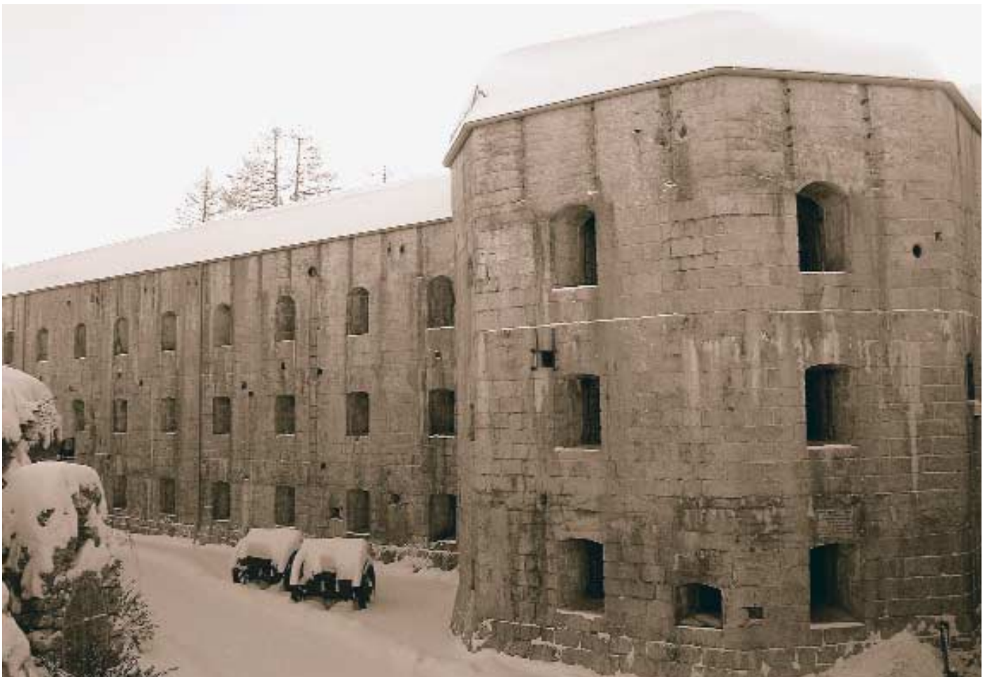
Lavarone, il Forte Belvedere