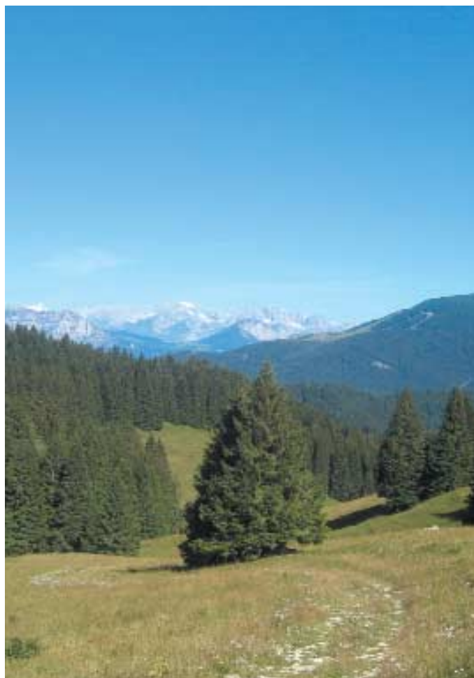
Pascoli, foreste, sentieri: la suggestione dell'Altipiano