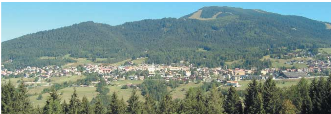
Folgaria da Mezzaselva