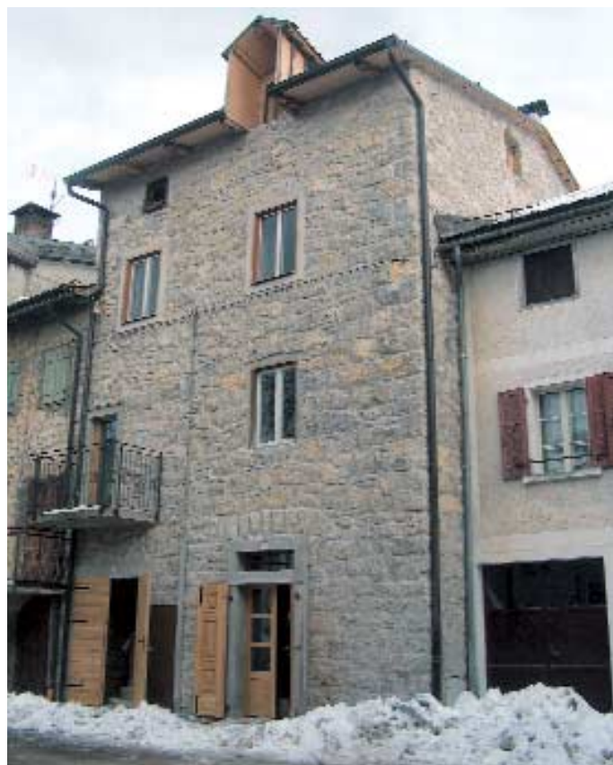
Luserna - Lusérn, casa Pedrazza, che ospiterà la pinacoteca

Sotto questo profilo molto può essere fatto per valorizzare le importanti risorse ambientali, storiche e culturali delle tre comunità.