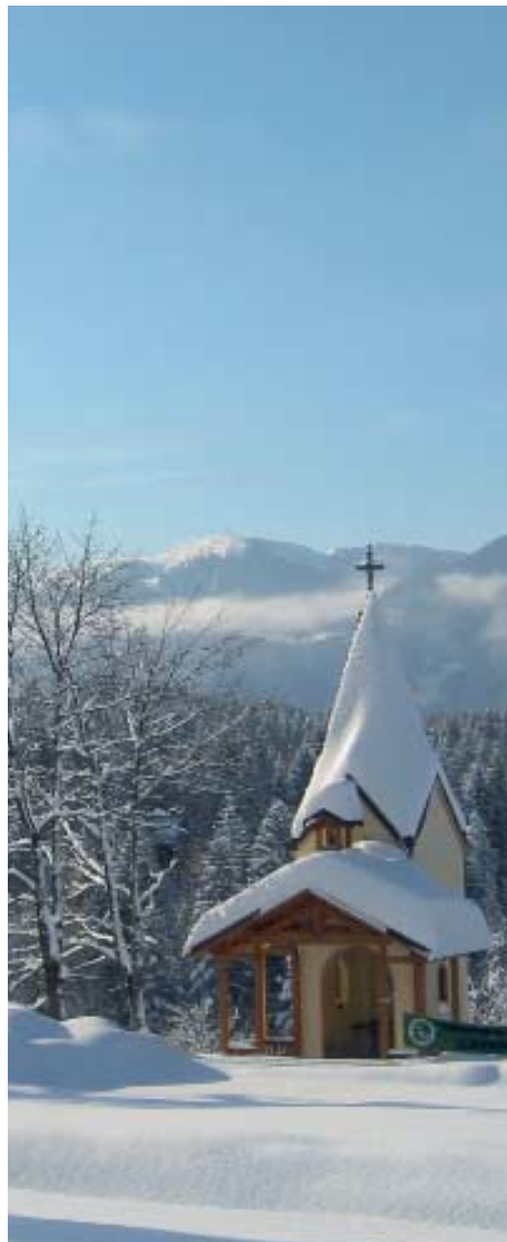
Lavarone, frazione Gionghi, chiesetta alpina