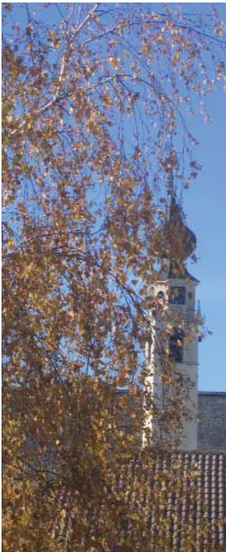
Folgaria, campanile della parrocchiale di S. Lorenzo

In sintesi, proponiamo di avviare un cammino per arrivare quanto più preparati possibile alle scadenze imposte dalla riforma istituzionale convinti che, in questa fase, tracciare un percorso già costituisce un bel tratto di strada che ci permetterà di capitalizzare un considerevole vantaggio del quale le nostre Comunità hanno estremo bisogno in considerazione che il futuro non sarà facile per nessuno.