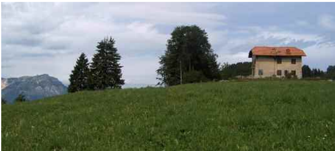
ex Ponte Radio