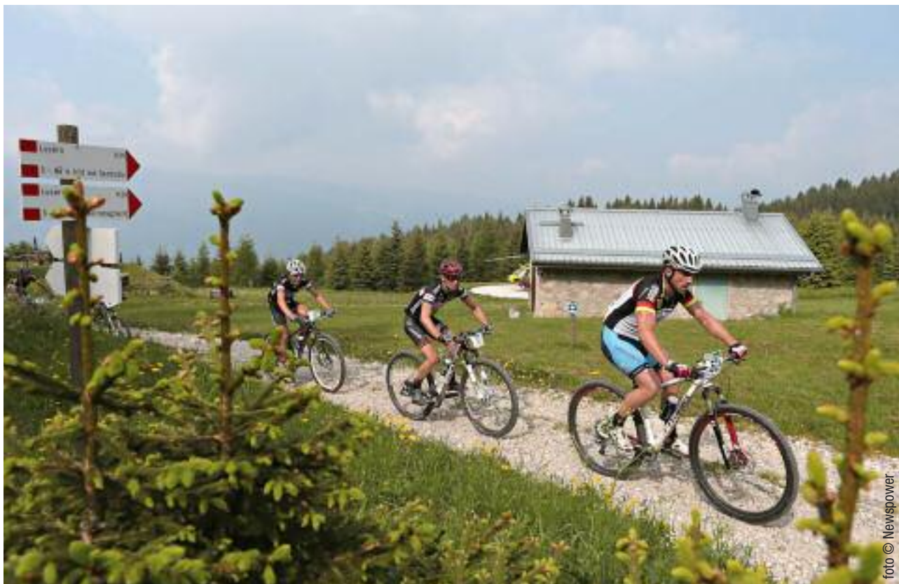
Ha preso avvio il progetto per realizzare una Pista Ciclopedonale Trentino –Veneta che collegherà l'altipiano cimbri a quello di Asiago

Atz lest, bar hãm gelekk 'z liacht von beng in Hof von Kastelé - Prach - Cima Nòra - Plètz, vor drai naüge häü-sar un vor di famildje boda lem sèmm, in allz 11 lusérnar.