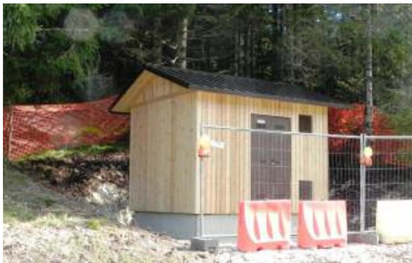
La nuova cabina SET a Monterovere