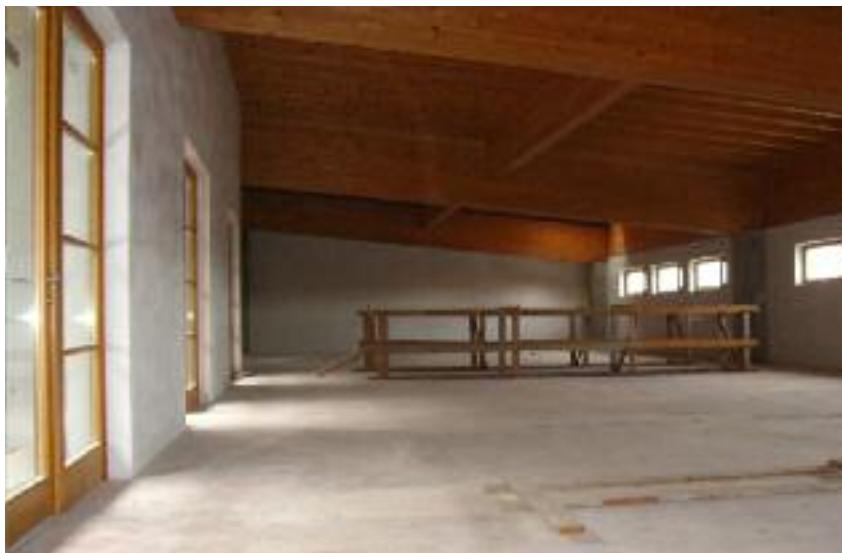
Uno dei locali a destinazione "servizi" posti al 1° e 2° piano del Centro artigianale

quello veneto rispetto al quale i territori di Lusérn, Vezzena (Levico) e Lavarone assumono una collocazione centrale. Il cicloturismo rappresenta un settore in forte espansione soprattutto nell'area tedesca ma non solo e se tale opera verrà concepita e gestita con creatività e intelligenza potrebbe essere paragonata come chilometri alla famosissima Dobbiaco-Lienz, ma dal punto di vista ambientale e climatico sarebbe sicuramente migliore. È un'iniziativa quindi da spendere su tutti i mercati europei e ultimamente anche sul mercato americano che dimostra un trend crescente di amanti del mountain-bike e della bicicletta in genere. Una tale opera oltre all'indubbia valenza turistica e quindi economica comporterà annualmente interventi di manutenzione e quindi anche opportunità di lavoro.