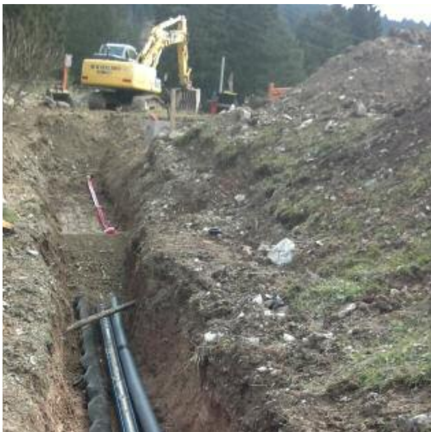
Un tratto di scavo presso il Biotopo di Malga Iagheretto

La prima tratta di 1,5 km che parte dalla sorgente Seghetta e arriva fino a Malga Laghetto, è già stata realizzata da SET Distribuzione.