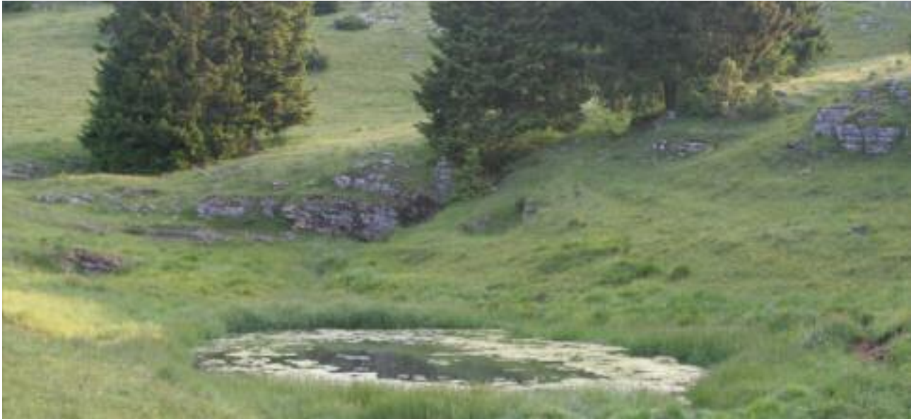
La sorgente di Campo Rosa, da sempre indicata come termine (confine) della Giurisdizione di Caldonazzo

te di Luserna, i fieni e le biade degli uomini di Luserna” 3 .