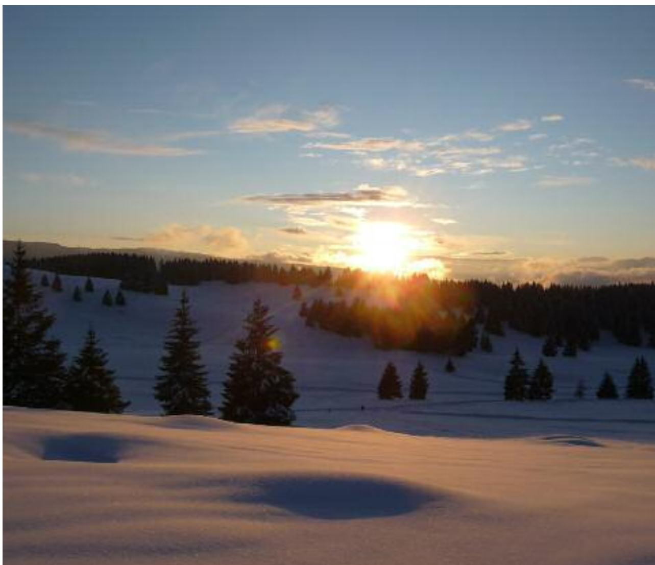
Alba a Millegrobbe

zur Verfügung stehenden Budgets zugewiesen (11.000 Euro im Jahr 2013). Die Wertschätzung seitens der Gemeinde in Hinsicht auf die Tätigkeiten unserer Vereine, kann sich nicht ausschließlich durch die Höhe der zugewiesenen Beiträge ausdrücken, denn in Luzern gibt es auch Vereine, die den soeben genannten gleichgestellt sind und Tätigkeiten anbieten, die ebenso wichtig und bedeutungsvoll sind, jedoch niemals um finanzielle Unterstützung angesucht haben. Abschließend wird darauf hingewiesen, dass das Budget für Vereine im Haushalt 2014 mit 11.000 Euro veranschlagt wurde und die Kommission derzeit die vorbereitenden Bewertungen für die Ausbezahlung der Beiträge ausarbeitet.