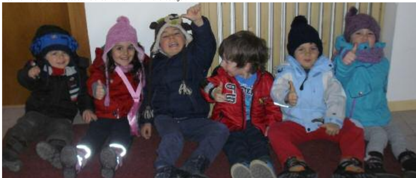
Alcuni bimbi del servizio educativo di continuità "Khlummane lustege tritt"