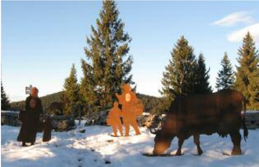
La prima neve sul sentiero della Grande Guerra "Dalle storie alla Storia"