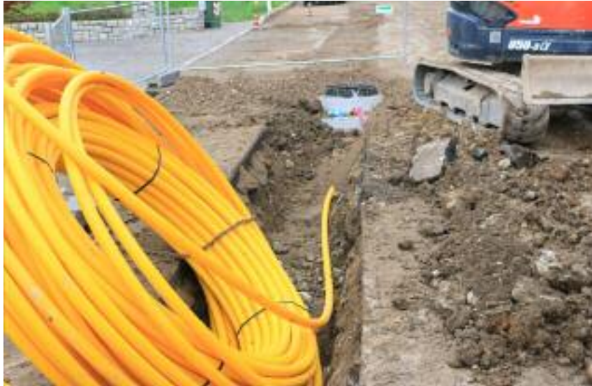
Posa del cavidotto per la fibra ottica

A seguito di asta pubblica la Malga Costesin Bassa è stata assegnata in gestione per cinque anni al canone