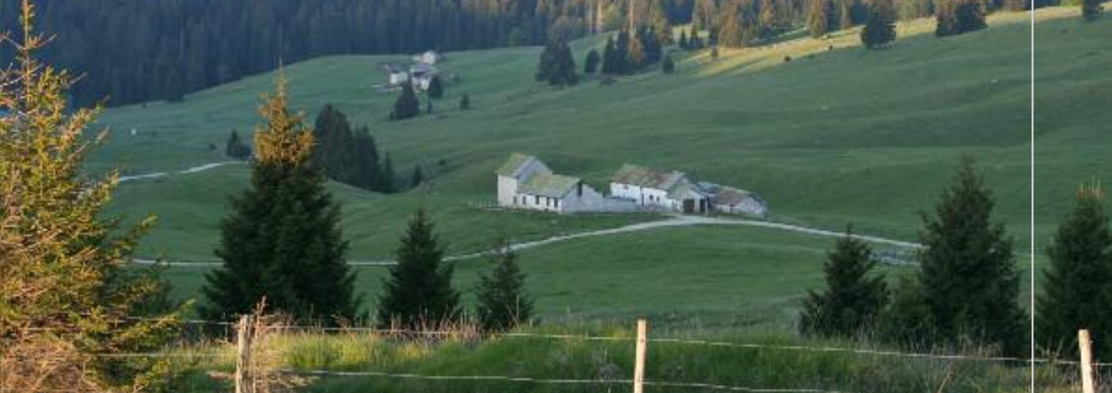
Busa Biseletto ovvero Mingotto

> Gruppo Storico Fotografico "A. Bellotto" Luserna/Lusérn, Arturo Nicolussi Moz