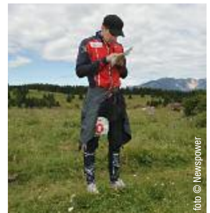
WTOC 2014 - Campionati del Mondo di Orienteering e Trail Orienteering

In einer wirtschaftlich prekären Situation gehen wir davon aus, dass wir Lusern als Ortschaft für Qualitätstourismus für eine ständig wachsende Interessenschaft nur dann anbieten können, wenn wir unsere Kräfte, unsere Ideen, unsere Projekte und unsere Initiativen vereinen.