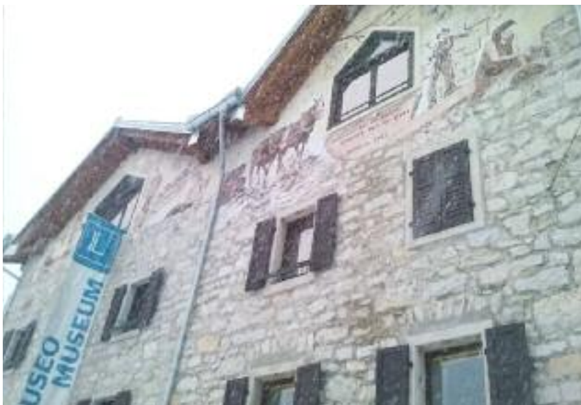
Scalpellini, merlettaie... I nuovi affreschi sulla facciata del Museo illustrano le attività tradizionali della cultura cimbra