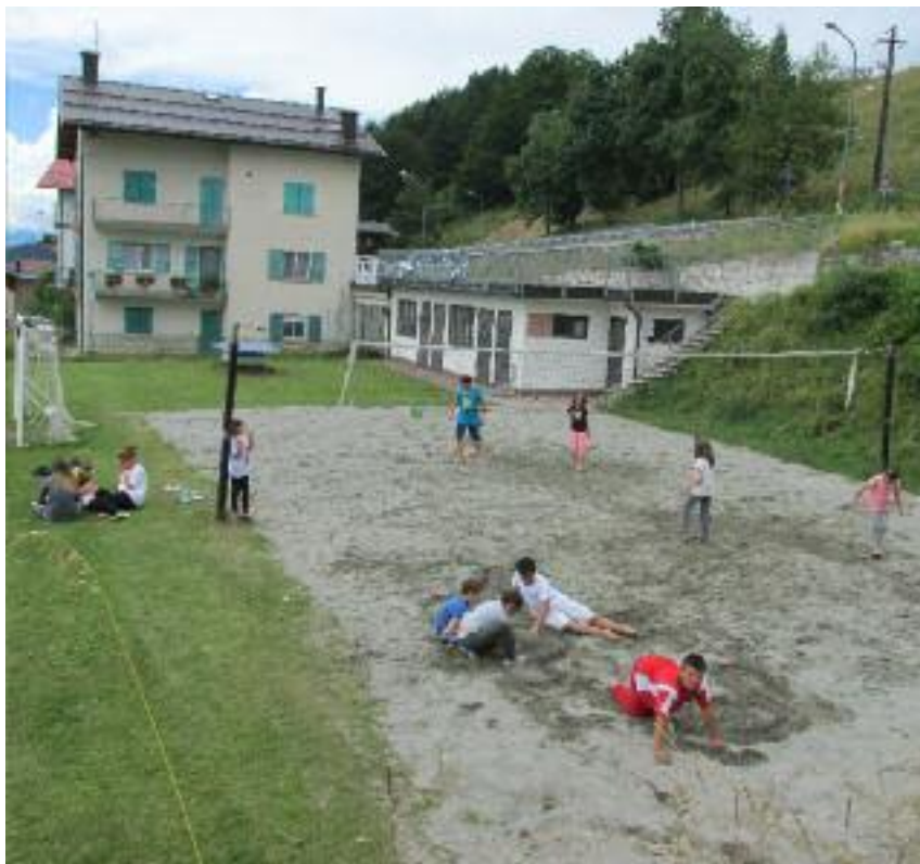
"Beach volley" a Lusérn

'Z tüat ànt seng ke dar Kamou vo Lusérn haltet nèt vil kunt von ünsar getüana: sidar 'z djar 2010 hattaz gèt lai 500 € kontributo ànka aztada dar regolament von kamou vürleget kontribute vor di sportiv un kultural verainen. Haür hòbar gevorst mearar vert zo maganaz vennen zo reda pittar Djunta, ma sa hånaz nia respundart. Bar hãm auzgemacht zo tüana bintsche zoa zo zera mindar un zo maga übarlem. Bar hãm gesüacht zo tüana