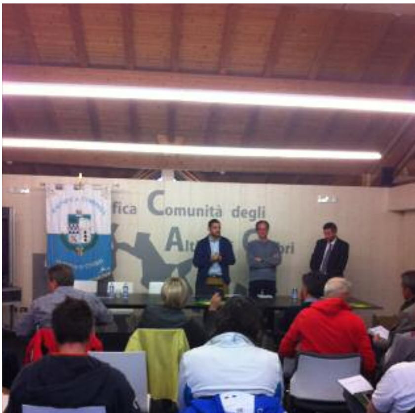
L'incontro per la firma del protocollo Altipiani Accessibili - Open Area

Die Gemeinschaft hat die Auflagen für die Gewährung von Beiträgen im Falle von Baumaßnahmen in der Erstwohnung umgesetzt. Für Sanierungseingriffe bzw. Energiesparmaßnahmen