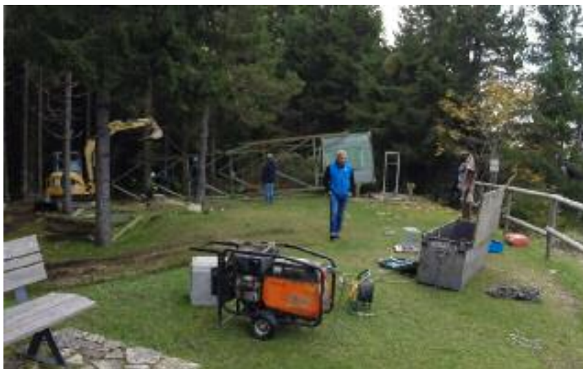
Demolizione traliccio nelle vicinanze degli avamposti Oberwiesen e Viaz

Il Comune di Folgaria, quale ente capofila del progetto, ha concluso la procedura per l'individuazione del soggetto esecutore del 1° lotto da Roana a Lusérn. Nel frattempo è stata ripresa la procedura espropriativa necessaria per l'acquisizione delle aree site nel Comune di Lusérn di proprietà privata. L'intervento è finanziato con i c.d. Fondi Odi e vedrà presumibilmente l'inizio lavori ancora entro l'attuale anno. Trova quindi avvio un intervento di infrastrutturazione "strategico" in quanto apre finalmente un collegamento tra l'Altopiano trentino e