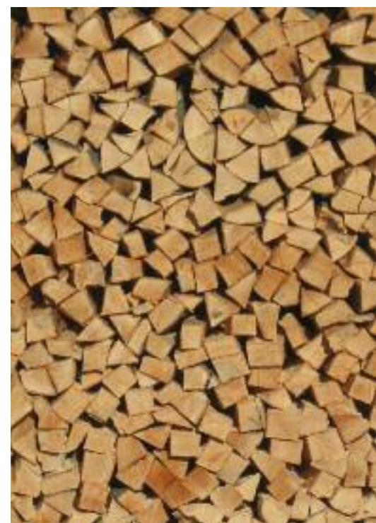
Una porzione di legna da ardere per gli anziani over 75 di Lusérn

Ma hatt gerift di arbatn zo vorgröazra in bèrkstatt zentrum. Da soin khent vorzist alle di magazin von untar piàno, in allz dar kamou bart vängen 22.000 € vo zis atz djar. Invetze di lokéln von earst un von zboate piàno, boda muchatn khemmen genützt vor di burò, soin no ler ombromm fin est soinda nonet khent augelest näüge