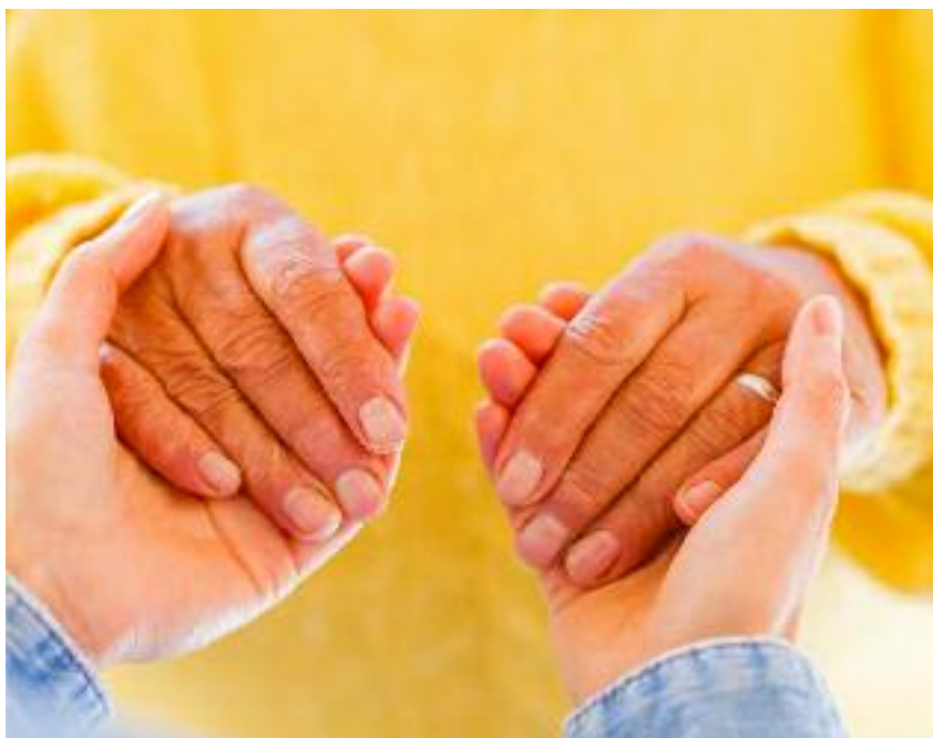
Il Progetto Coccole, per stare accanto alle persone più bisognose di aiuto

l'identità e il senso della Comunità di Valle, l'offerta turistica locale, il sistema economico produttivo, il paesaggio e le infrastrutture. Soggetti pubblici e associazioni portatrici di interessi sono stati invitati, mediante avviso pubblico, a partecipare al nuovo tavolo di confronto e di consultazione. A oggi si sono realizzati un momento di presentazione del percorso e due serate di discussione. Una volta terminata questa fase, la legge prevede una conferenza per la stipulazione e l'approvazione dell'accordo quadro di programma. Lo strumento diverrà fondamentale nel definire, "sotto il profilo urbanistico e paesaggistico, le strategie per uno sviluppo sostenibile del rispettivo ambito territoriale" del futuro della Magnifica Comunità degli Altipiani Cimbri.