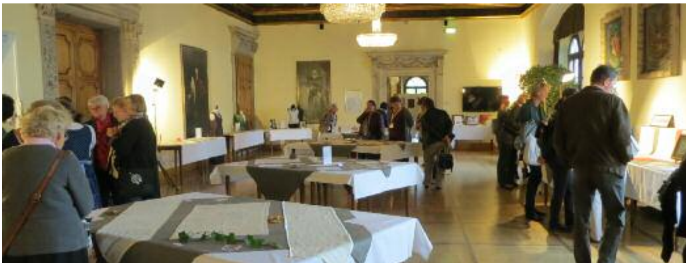
6° Spitzen Ausstellung Kongress. Organizzato dal Verein Klöppeln und Textile Spitzenkunst in Österreich presso il Castello Porcia, ha ospitato una vastissima esposizione di merletti provenienti da tutta l'Austria, ma anche dalla Russia e... da Lusérn

Vom 25. bis zum 28. September waren wir nach Spittal an der Drau (Österreich) eingeladen worden, unser Handwerk auszustellen. Diese Veranstaltung war vom Verein Klöppeln und Textile Spitzenkunst in Österreich organisiert worden.