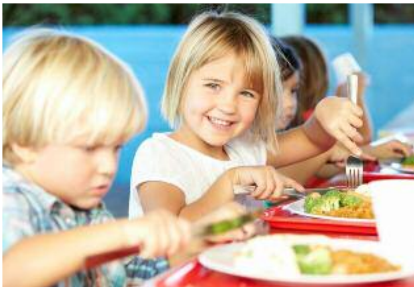
Nelle mense scolastiche dell'Altipiano i pasti vengono preparati direttamente nei punti cottura delle rispettive scuole

Il Piano Territoriale di Comunità è uno strumento di pianificazione urbanistica elaborato dalle Comunità di valle, che si colloca a metà strada tra il "Piano Urbanistico Provinciale" elaborato dalla Provincia Autonoma di Trento e i singoli "Piani Regolatori" comunali. Il percorso di realizzazione del Piano territoriale è iniziato con la stesura di un Documento preliminare contenente un'analisi del contesto territoriale attuale che tratta argomenti quali