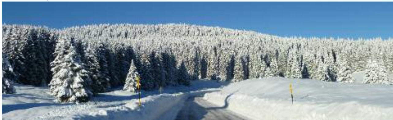
Vezzena. Strada per Luserna