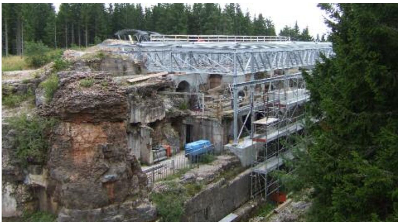
I lavori di recupero del Forte Werk Lusérn

del percorso "Sul sentiero della Grande Guerra - Dar staige von Groaz Kriage", denominato " Dalle storie alla Storia - Von stòrdje afte Stòrdja ", inaugurato, con riguardo al tratto ascendente, dalla Piazza G. Marconi - platz von Kamou al Forte, dall'Amministrazione comunale domenica 18.8.2013. Il percorso tratta il tema dello scoppio del primo conflitto mondiale, visto attraverso gli occhi degli abitanti del piccolo villaggio cimbri dell'epoca. Lungo il sentiero che da piazza Marconi - Plaz von Kamou conduce prima a Forte Campo - Werk Lusérn e poi all'avamposto Oberwiesen, sono state installate ventotto sagome di metallo raffiguranti persone e animali che raccontano in prima persona altrettante storie vere accadute tra gli ultimi anni dell'800 e il 25.5.1915, quando Lusérn si è svegliata sotto il fuoco incrociato dell'artiglieria italiana e di quella austroungarica. Ogni personaggio vuol far vivere nei visitatori le emozioni di allora attraverso domande e spunti di riflessione sull'atrocità e spietatezza della guerra. Agli escursionisti viene anche chiesto di prendere delle decisioni e di ope-