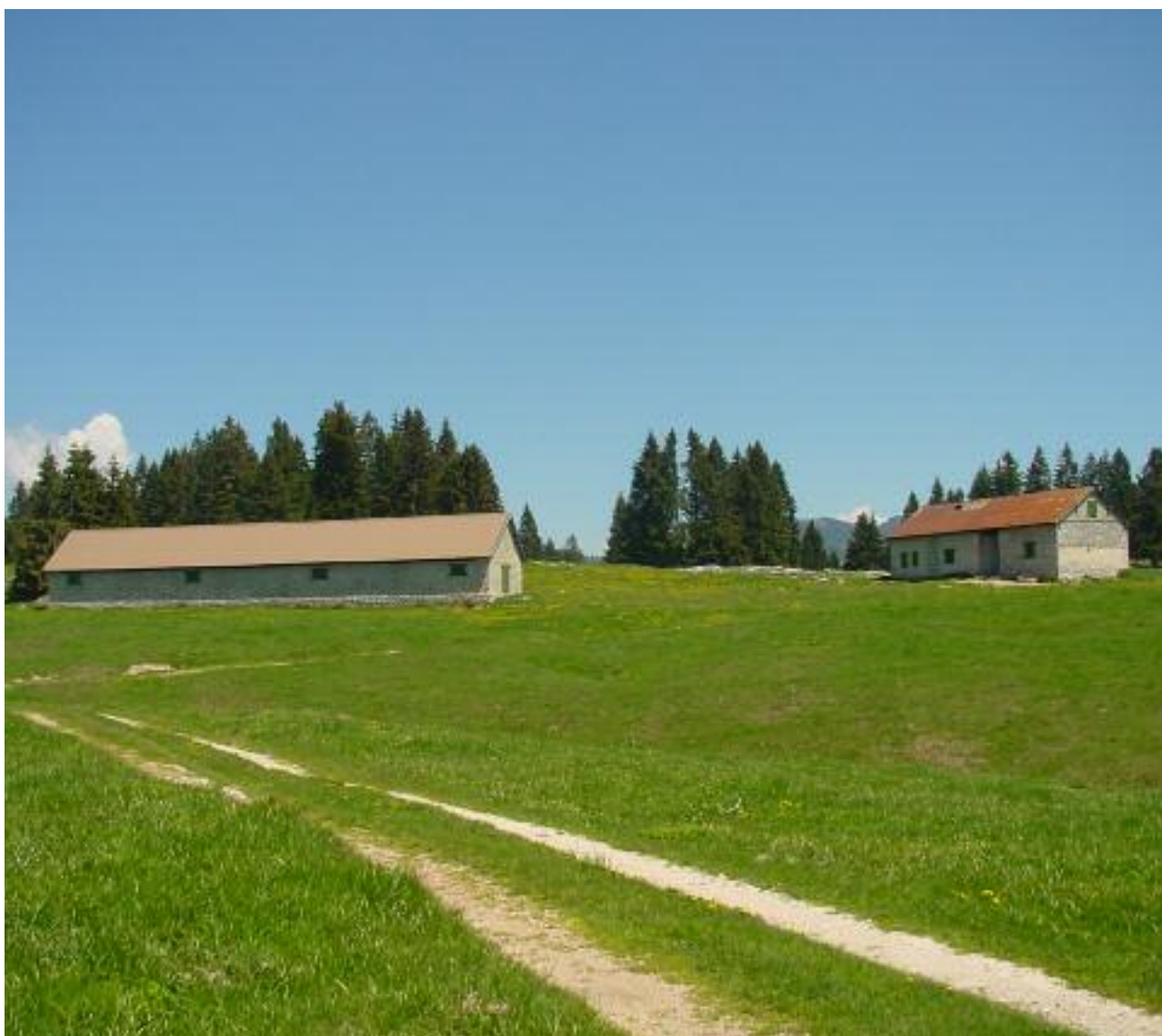
Khesar vo Kostalta - Malga Costalta