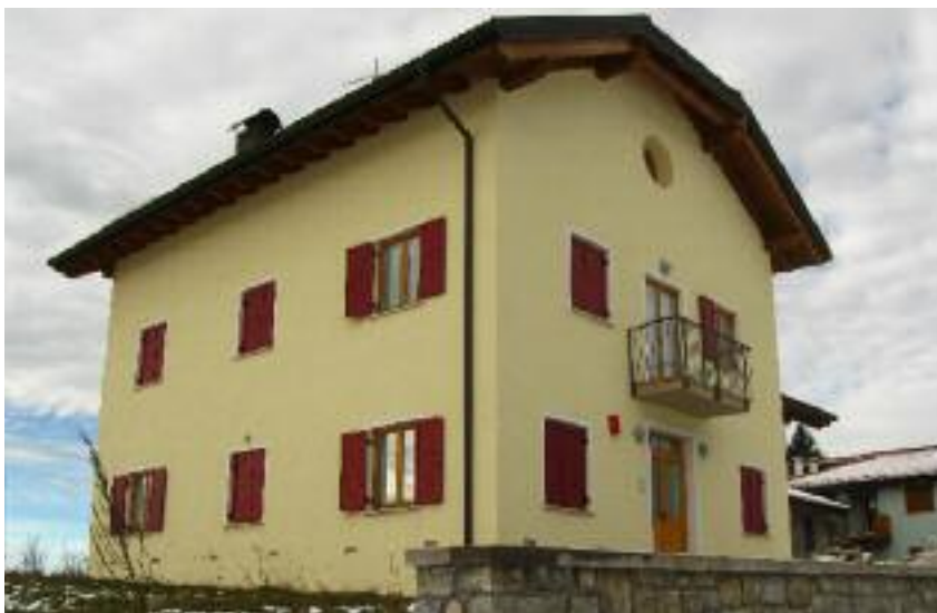
Ex Ponte Radio

Sono sostanzialmente conclusi i lavori relativi all'ampliamento del Centro Artigianale e Servizi per insediamento attività produttive – Apprestamento Area – da parte dell'impresa appaltatrice. Si sono quindi raccolte le conferme di interesse all'assegnazione dei locali da parte di vari soggetti che fin dall'origine avevano manife-