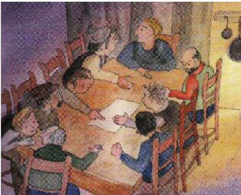
"In khurtza zait soinzase gevuntet alle in di hütt gemacht pitt lèrchan höltzar..."

In da baiz nacht iz gest allz a gemèkka, sang, hemmar, paildar, aniaglas hatt gemacht soi toal: laüt un vichar o.