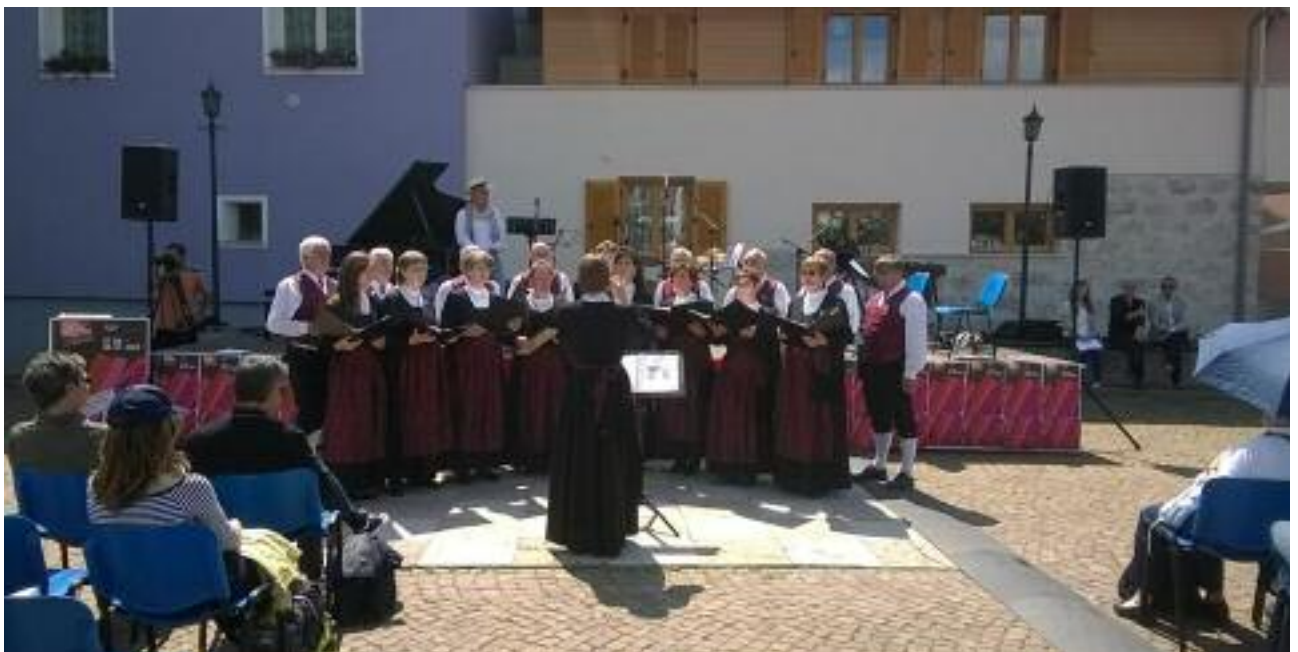
La partecipazione al Südtirol Jazz Festival - J'atz Lusérn

Ein Dankeschön an unserer Förderer. Ihnen und allen Lusernern wünschen wir Frohe Feiertage. Wir hoffen, dass das Jahr 2015 auch für den Chor ein Jahr voller Erfolge und Genugtuungen sein wird.