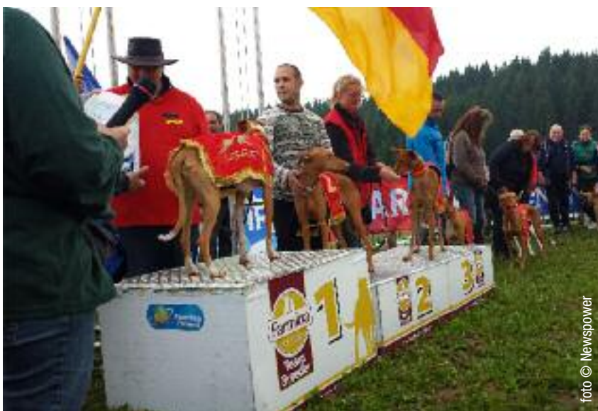
La premiazione dei levrieri vincitori del Campionato Europeo Coursing

In un momento economico difficile per tutti siamo certi che solo continuan-