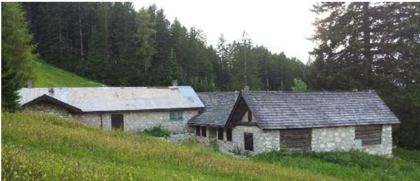
Lait vo Lusérn - Malga Rivetta

Auch die außerplanmäßige Instandhaltung des Wanderweges des Bären „Nå in tritt von Per“ wurde abgeschlossen. Dafür haben wir die Unterstützung des Museums für Wissen-