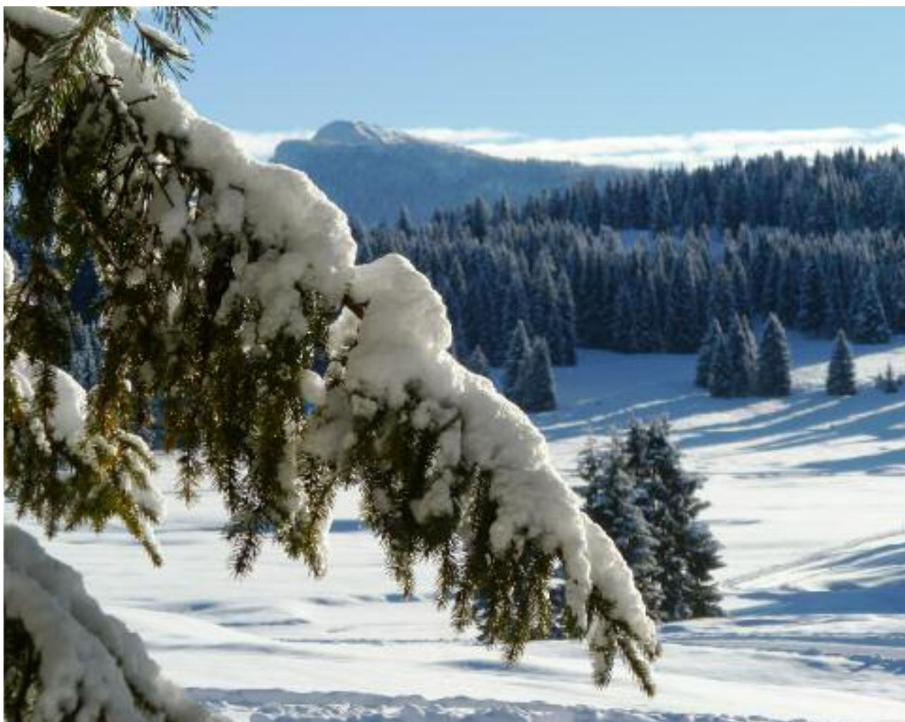
Millegrobbe con Cima Verena sullo sfondo

Stellvertretender Vorsitzender der Gemeinschaft der Zimbrischen Hochebene